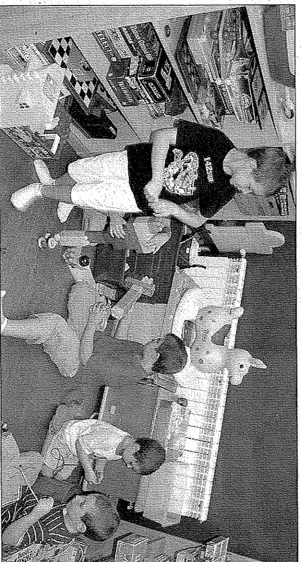
La Ludoteca está perfectamente equipada con múltiples juegos.

La Ludoteca está situada en la sede de Cruz Roja Española, calle San Antonio nº 19.