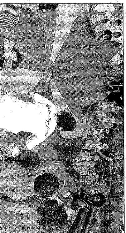
Una imagen de las actividades del pasado año.