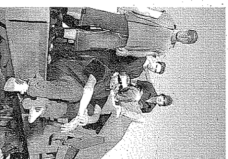
El cuarteto Hora Zulu.

Lo que ha hecho Qijano no ha sido exponer parte de su obra histórica y actual, sino que ha sido intervenir, transformar, recrear un espacio en una obra de arte efímera, pero no por ello menos valiosa, sino al contrario, pues al valor artístico del contenido ha unido el hecho, único e irrepetible, en la conjunción de espacio, tiempo, forma, color, volumen, voz, música y emoción.